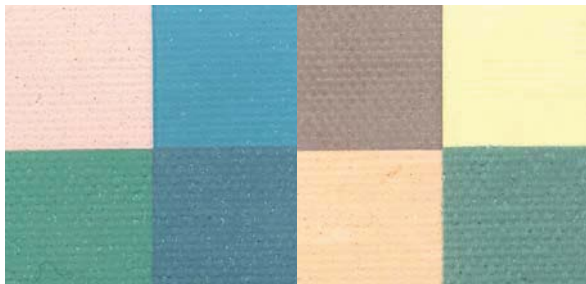
sans application du Lascaux Vernis transparent

Si le vernis est appliqué au rouleau, il convient de prendre certaines précautions pour éviter la formation de bulles d'air: utiliser le rouleau adéquat, p. e. le modèle «Microstreif» 2350 de PEKA. Pour une hygrométrie normale, c'est-à-dire comprise entre 40 et 60 %, la température de mise en œuvre ne devrait pas être inférieure à + 8° Celsius.