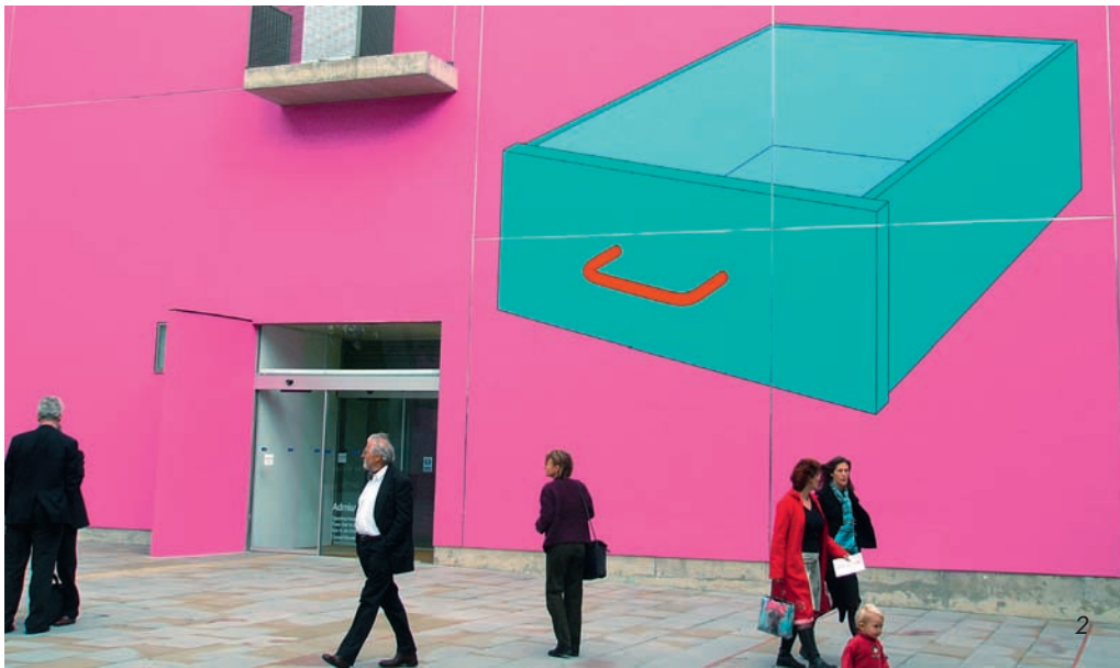
2 The Magenta House, Milton Keynes Gallery, Milton Keynes/GB; Künstler: Martin Craig-Martin